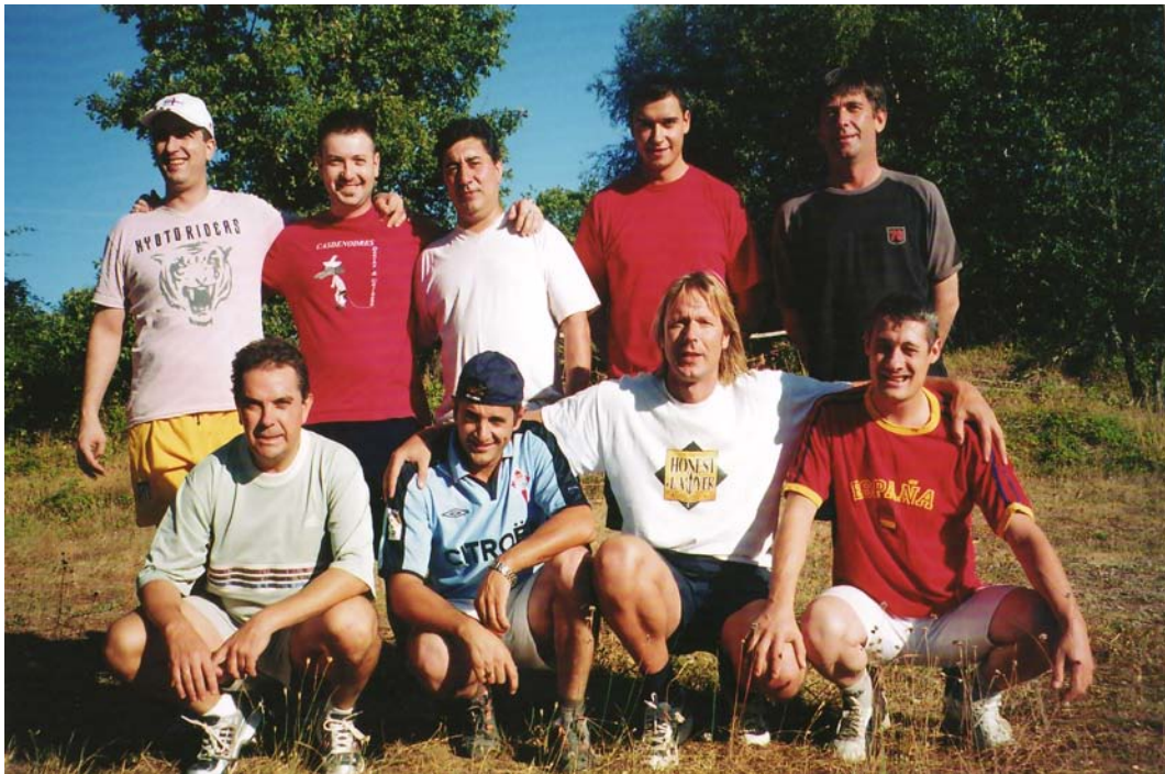
Foto.- Aquí temos os gañadores do partido de fútbol deste vrao entre solteiros e casados (os casados).