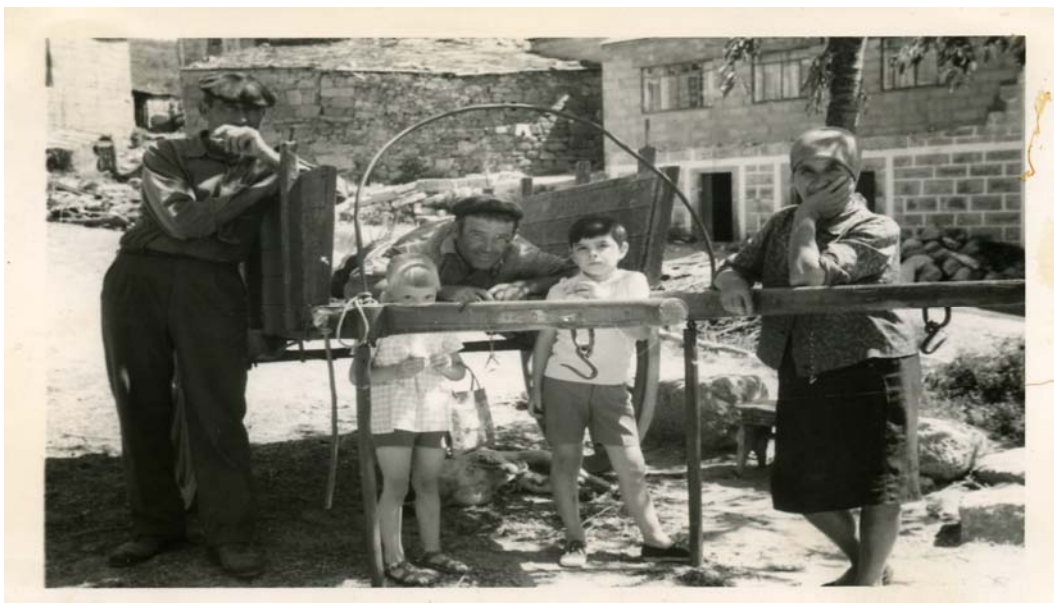
Foto.- Aquí temos fai uns poucos de anos estas xentes do pobo.