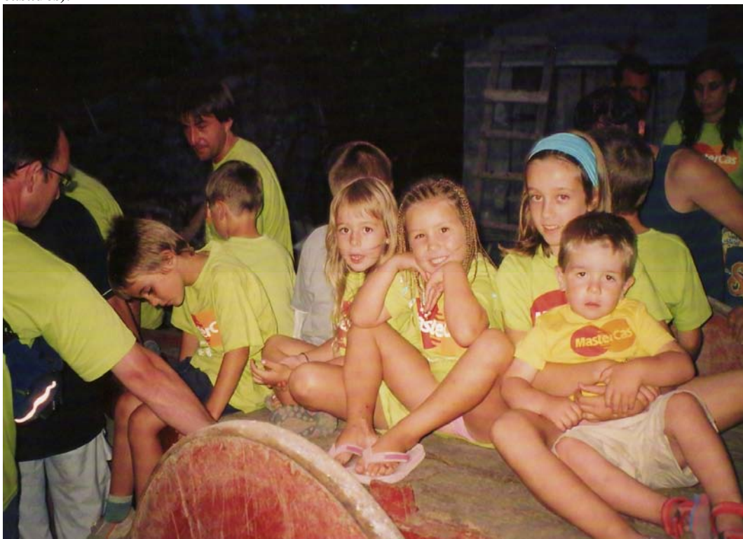
Foto.- Aquí temos os nenos subidos no carro o día 7 de Agosto.