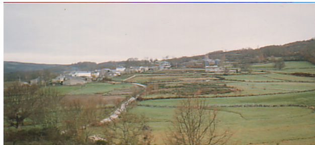
Foto.- Imaxen do noso pobo. Casdenodres