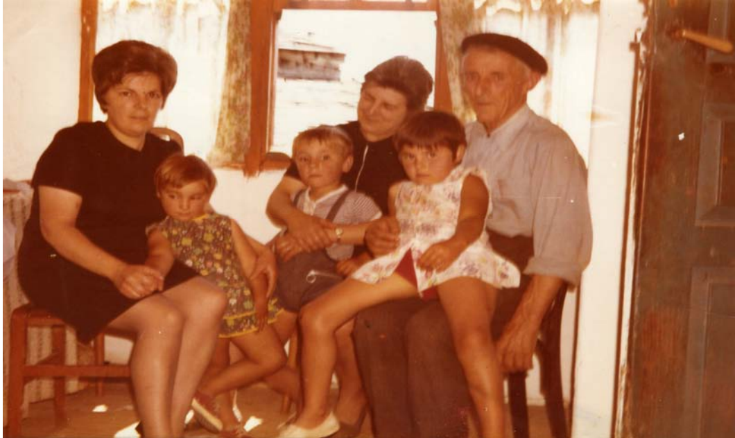
Foto.- Aquí temos fai uns poucos de anos estas xentes do pobo.