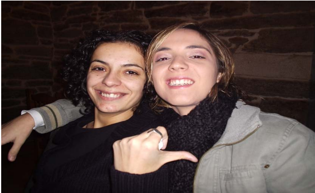
Foto.- Aquí temos á xente nova de Casdenodres nunha cea das que facemos cada pouco.